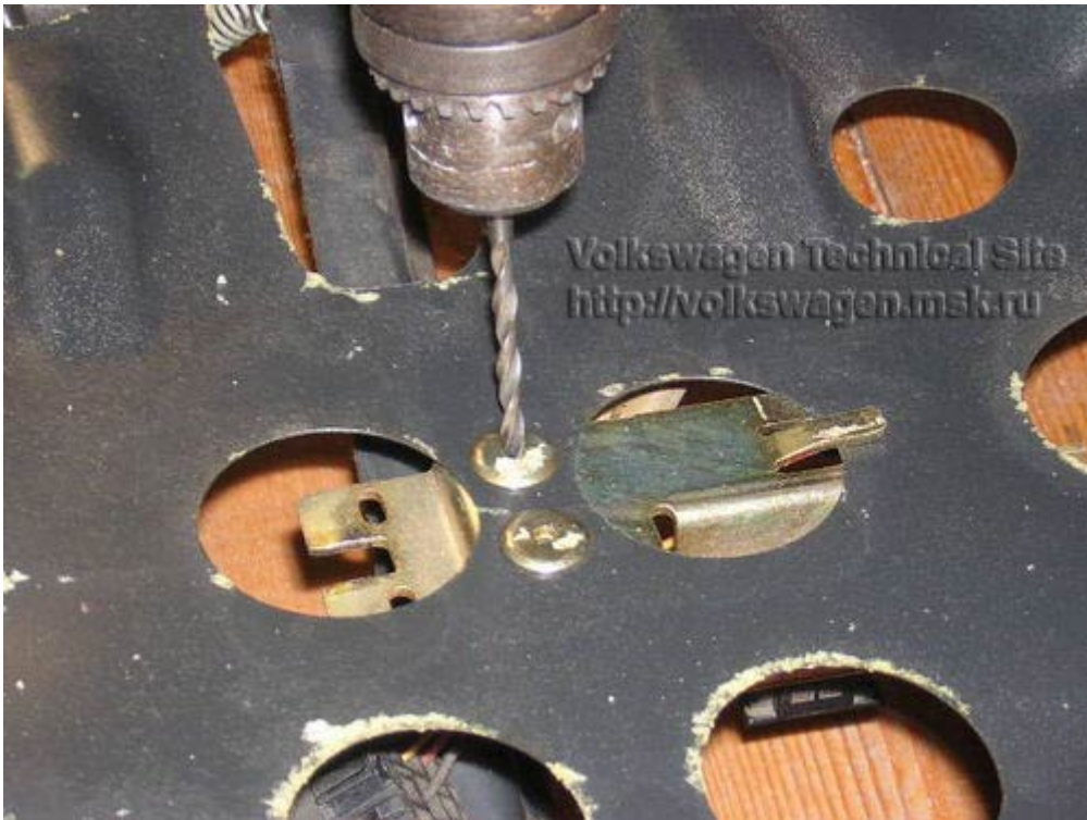
Переставляем блок регулировки подогрева. Высверливаем клипсы блока с простой сидухи.