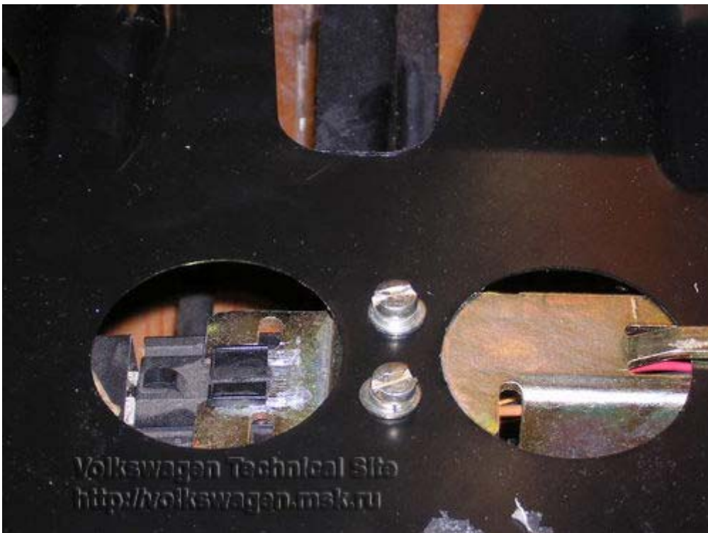
Тот же блок после перестановки на ГТИ-шной сидухе.